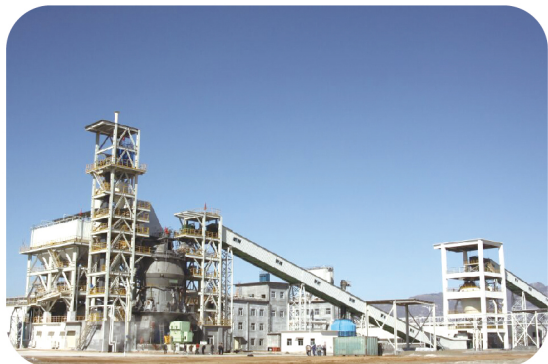
德国原装进口LM53.3+3S型磨机